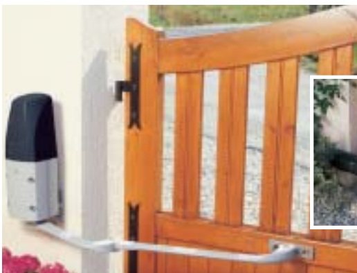
Motorisation à bras articulé pour portail battant

L'alimentation solaire permet au système de fonctionner en totale autonomie : idéal si votre portail est éloigné de votre habitation ou si vous souhaitez préserver vos aménagements extérieurs. En cas de nécessité, une réserve d'énergie permet d'effectuer une cinquantaine de manœuvres.