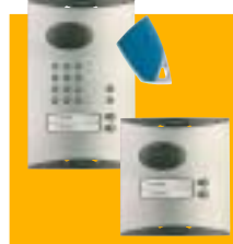
La platine de rue est disponible avec ou sans clavier, en version 1 ou 2 boutons d'appel.