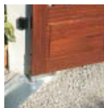
Motorisation enterrée pour portail battant