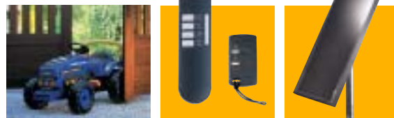
Choix dans le type de commande