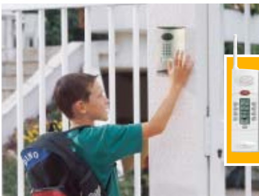
Un accès sécurisé

Pour un plus grand confort d'utilisation de nuit, les touches sont rétro-éclairées dès qu'elles sont sollicitées. Le blindage en métal brossé des platines de rue leur procure un nouvel esthétisme et une grande robustesse.