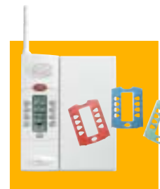
Personnalisation possible du combiné.