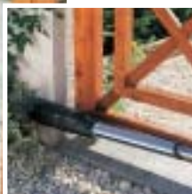
Motorisation à vérin pour portail battant