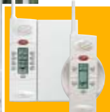
Les postes intérieurs sont alimentés par pile ou par le secteur.